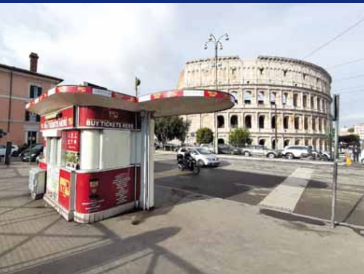
Piazza del Colosseo (Quiosco Big Bus Tours/Brastours)