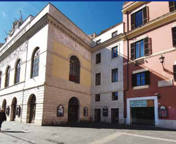
Via/Largo di Torre Argentina, 52 (Teatro Argentina)